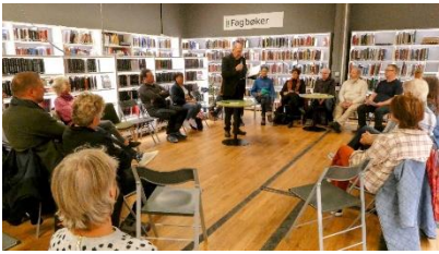
Fra fjorårets møte på Larvik bibliotek

33. søndag i det alminnelige kirkeår 2024 – 17. november - uke 47 – år B - 2024